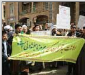
■ تجمع طلاب غیر ایرانی حوزه علمیه قم در محکومیت اهانت به قرآن