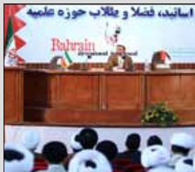
■ همایش بزرگ طلاب و فضلاء حوزه قم با موضوع بحرین مظلوم