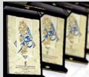
■ سیزدهمین همایش کتاب سال حوزه در قم